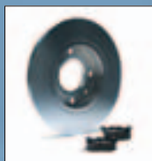
Детали тормозных механизмов