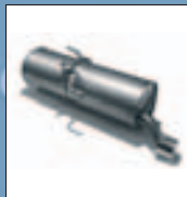
Детали выпускной системы